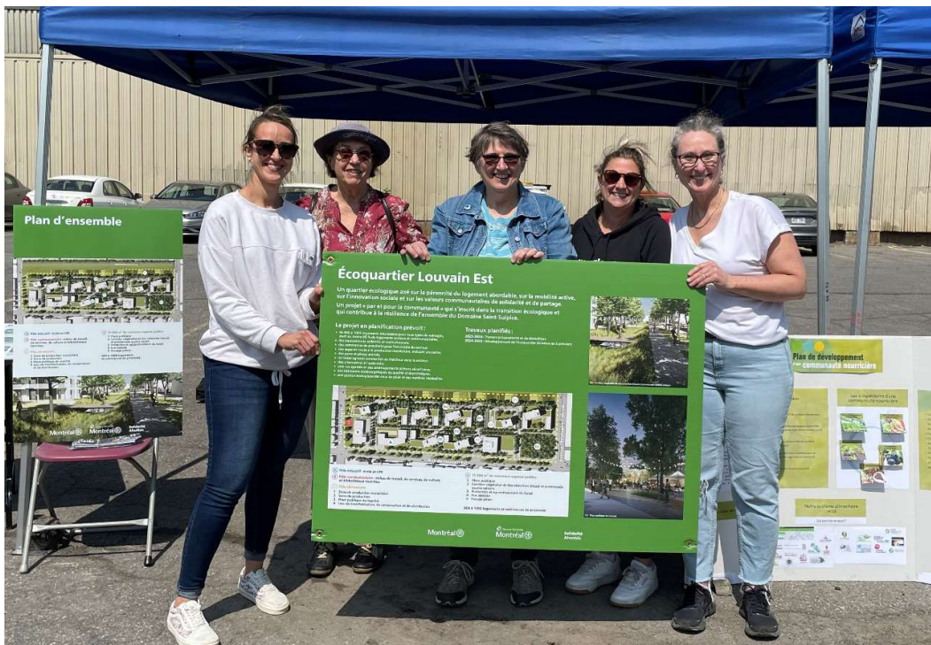
Stand de l'écoquartier Louvain lors de l'activité de distribution des végétaux de la Ville de Montréal le 27 mai 2023

Les membres du comité de pilotage ont aussi été sollicités pour quelques entrevues :